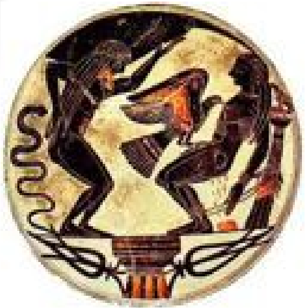
Le supplice de Prométhée sur une coupe antique.

À quoi est condamné Prométhée ? A être enchaîné à une montagne pour toujours. Un aigle lui dévore son foie qui repousse.