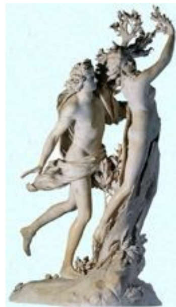
Daphné et Apollon Bernini

Que garde Apollon en souvenir de Daphné ? Des feuilles du laurier pour en faire des couronnes qu'il offrira à ceux qui diront de beaux poèmes et aux vainqueurs.