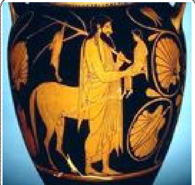
Chiron éduquant Achille amphore (520 avant J.-C.)

Pourquoi Chiron souhaite-t-il mourir ? Car il est blessé et il souffre.