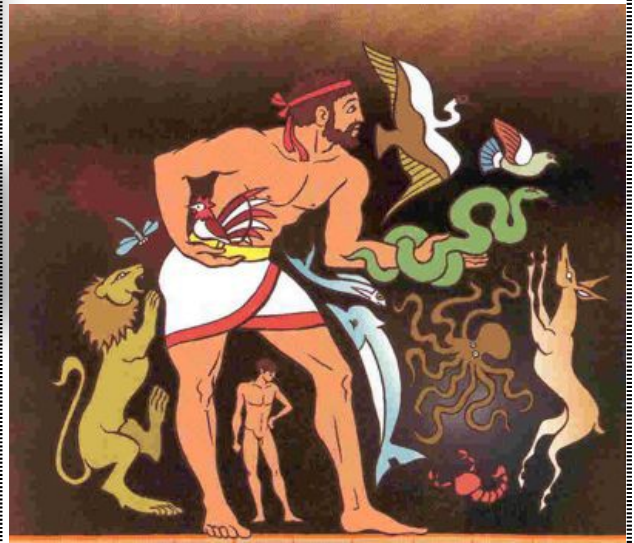
Épiméthée offre les attributs aux animaux

Que donne Prométhée aux hommes alors que Zeus le lui avait interdit ? L'intelligence.