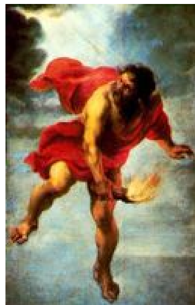
Prométhée dérobe le feu Jan Cossier

Dans quel but Prométhée a-t-il volé le feu aux dieux ? Pour réchauffer et éclairer les hommes.