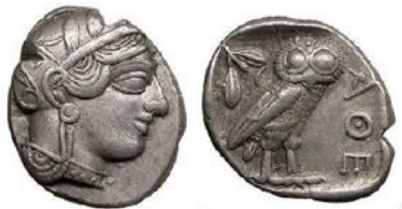
Pièce de monnaie grecque représentant Athéna

Que signifie le nom Prométhée ? « Le prévoyant, celui qui réfléchit ».