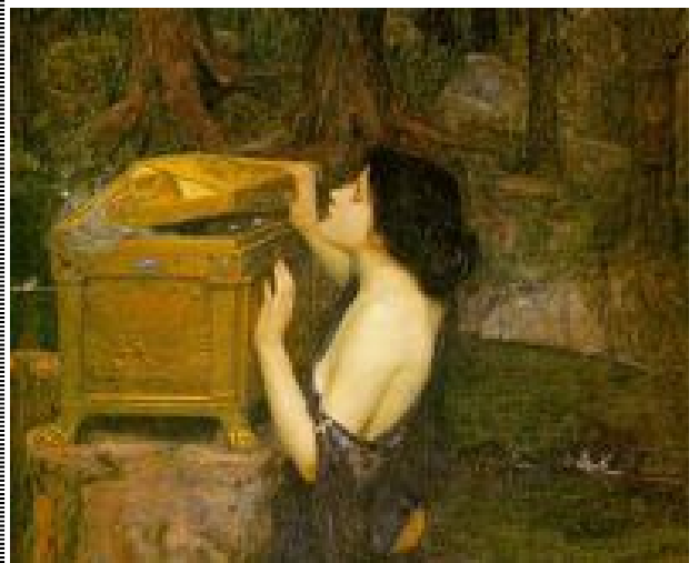
Pandora John Waterhouse

Que reste-t-il au fond de la boîte ? L'espérance.