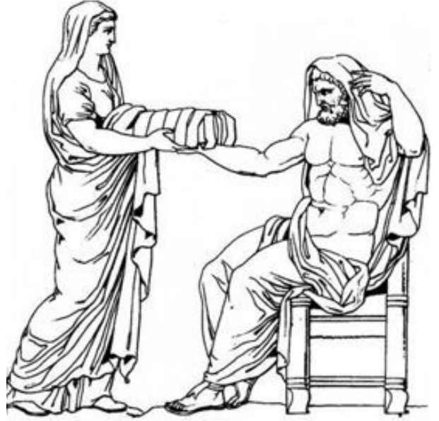
Rhéa et Cronos

Que donne Zeus à Amalthée ? Une corne magique toujours pleine de fruits délicieux, de fleurs parfumées et de toutes les bonnes choses que la chèvre aura envie de manger.