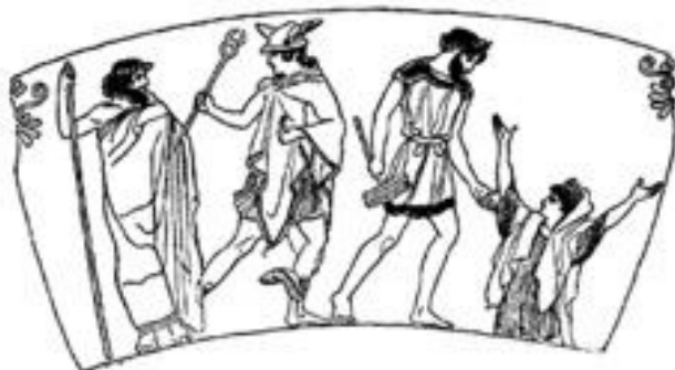
La création de Pandore

Pourquoi Prométhée fait-il promettre à son frère de refuser le cadeau des dieux ? Car il sait que Zeus prépare un mauvais tour et que cette femme Pandora a été créée pour se venger.