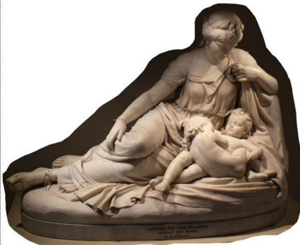
Léo et ses enfants

Qui sont les jumeaux ? Léo enfante (de Zeus) Artémis et Apollon.