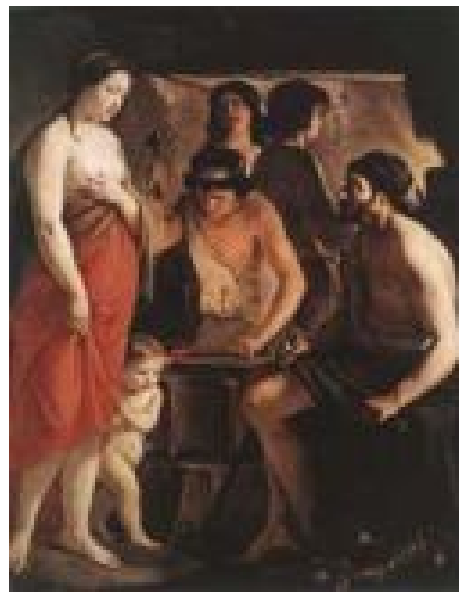
Vénus dans la forge de Vulcain Louis Le Nain

Quelle question se pose Hermès à la fin de l'épisode ? Pourquoi tous les dieux obéissent à son père Zeus ?