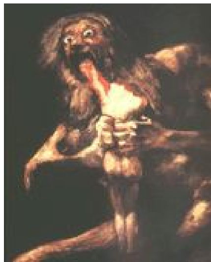
Saturne dévorant un de ses enfants Goya

Quel est le nom romain de Cronos ? Saturne