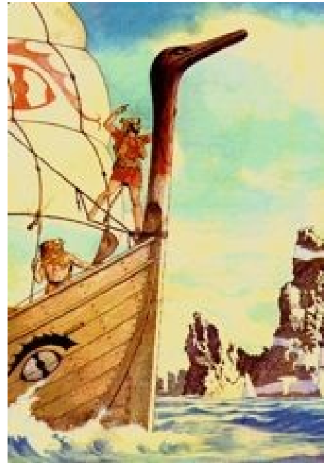
L'Argo s'approchant de Lemnos