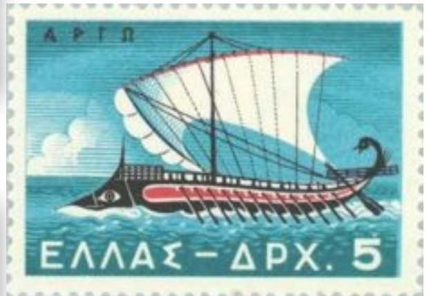
L'Argo, bateau des Argonautes timbre grec

Que met Jason à la proue (l'avant) de son bateau l'Argo ? Un vieux chêne qui avait passé sa vie près de Chiron.