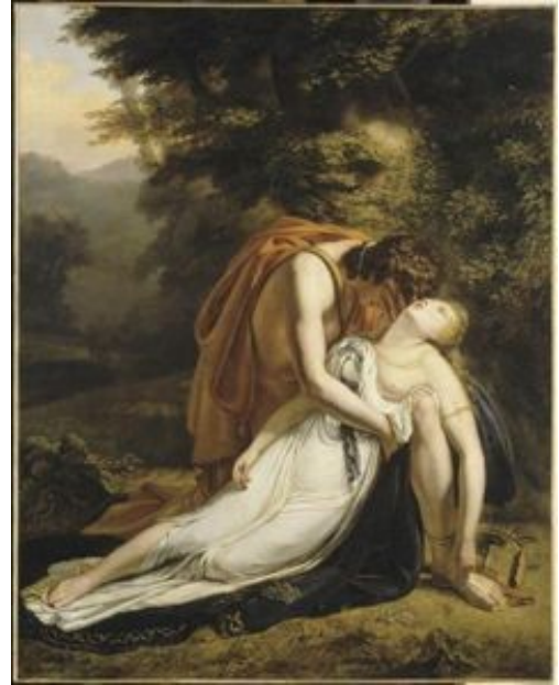
La mort d'Eurydice Scheffer Ary, 1814

Qui est Charon ? Celui qui fait traverser le Styx aux morts.