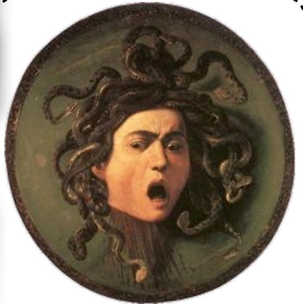
La Méduse Le Caravage, 1599

Pourquoi cette aventure est-elle périlleuse ? Car jamais personne n'est revenu vivant d'une rencontre avec la Gorgone.