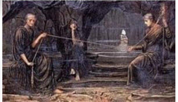
Un fil d'or J. M. Strudwick, 1885

Quel nom découvre Hermès sur le mur ? Persée