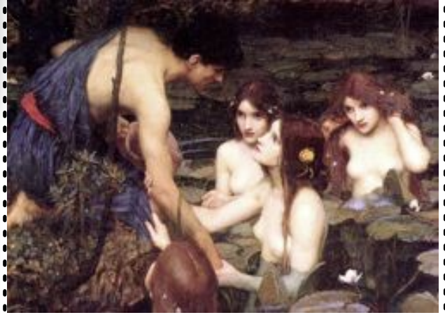
Hylas et les nymphes

Que décide de faire Jason ? Il consulte le vieux chêne qui lui dit que d'autres aventures attendent Héraclès et qu'il ne fait pas partie de ceux qui ramèneront la Toison d'or.