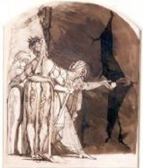
Persée rendant leur œil aux Grées J. H. Füssli, XVIII e

Que propose Athéna à Persée pour vaincre Méduse ? D'utiliser son bouclier et de l'utiliser comme miroir.