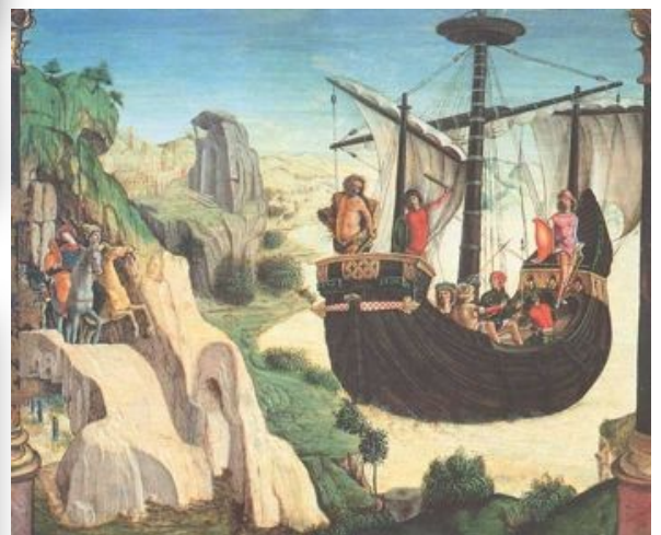
Arrivée de Jason et des Argonautes sur les côtes de Colchide