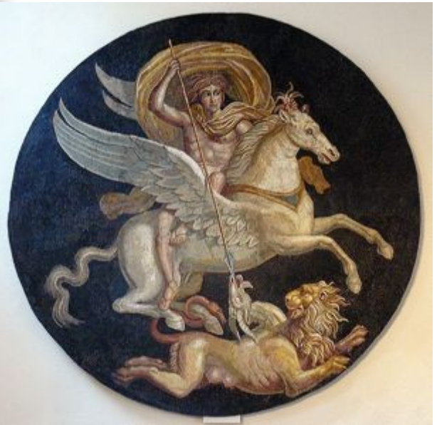
Bellérophon sur Pégase tuant la Chimère

Comment Zeus punit-il Bellérophon ? Il lui jette son foudre ce qui l'envoie s'écraser en bas du terre.