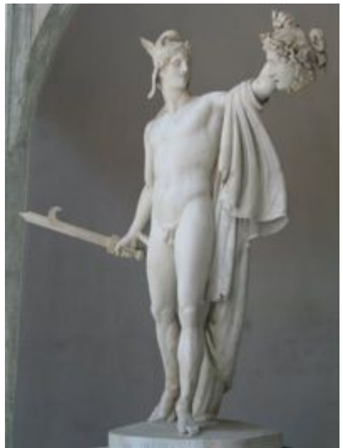
Persée tenant la tête de Méduse A. Canova, 1806

Que se passe-t-il au moment où Persée tue Méduse ? Un cheval ailé du nom de Pégase surgit du corps de Méduse.