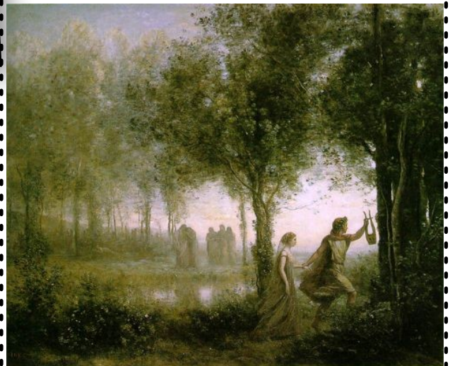
Orphée ramenant Eurydice des enfers C. Corot, 1861

Hadès l'avait-il trompé ? Non, car Eurydice suit bien Orphée.