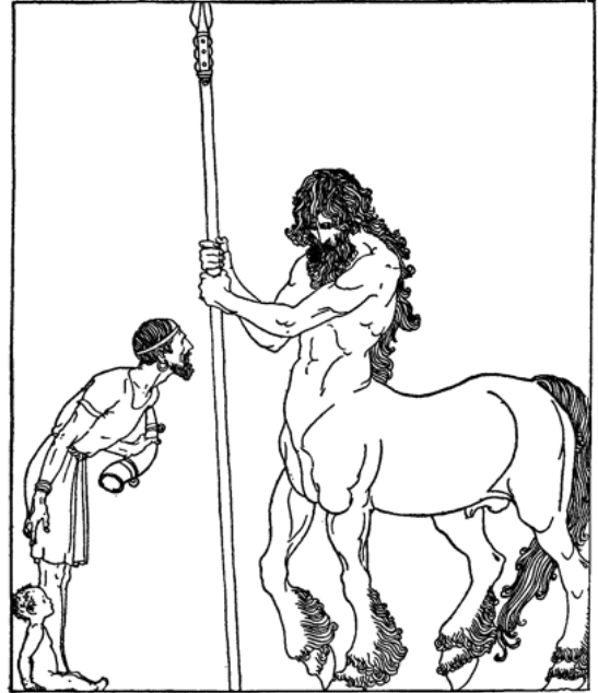
Chiron et le jeune Jason amené par un esclave

Pourquoi Jason veut-il se venger de Pélidas ? Car son oncle Pélidas a voulu le tuer quand il a pris le royaume de son père (Iolcos).