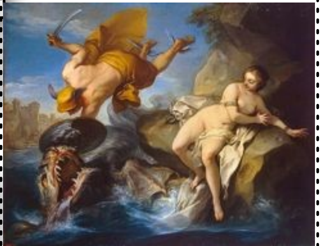
Persée et Andromède Carle Vanloo, 1740