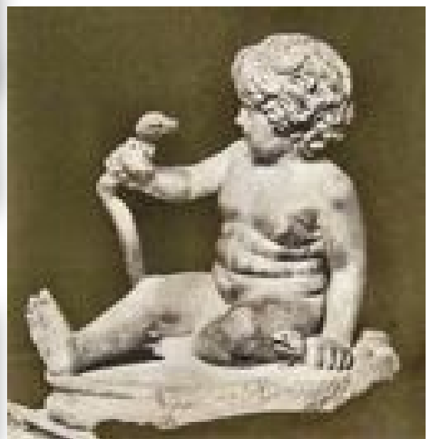
Héraclès enfant étouffant les serpents

Car il vient de se battre et de tuer tous les Géants.