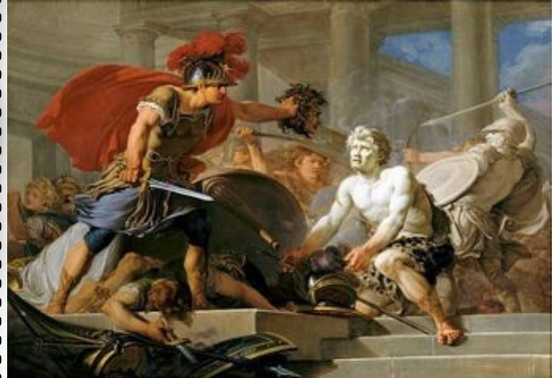
Persée pétrifiant Phinée et ses soldats lors de son mariage H. Taraval, 1767

Quel souvenir Athéna garde-t-elle du combat de Persée ? La représentation de la tête de Méduse sur son bouclier.