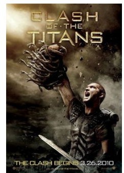
Des films sur l'histoire de Persée